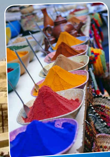
Auf den Märkten finden Touristen Gewürze in allen Farben

Ob beim Schnorcheln, luxuriös auf einer Nilkreuzfahrt oder als Entdecker jahrtausendealter Kultur – in Ägypten finden Sie den Urlaub, den Sie schon immer genießen wollten